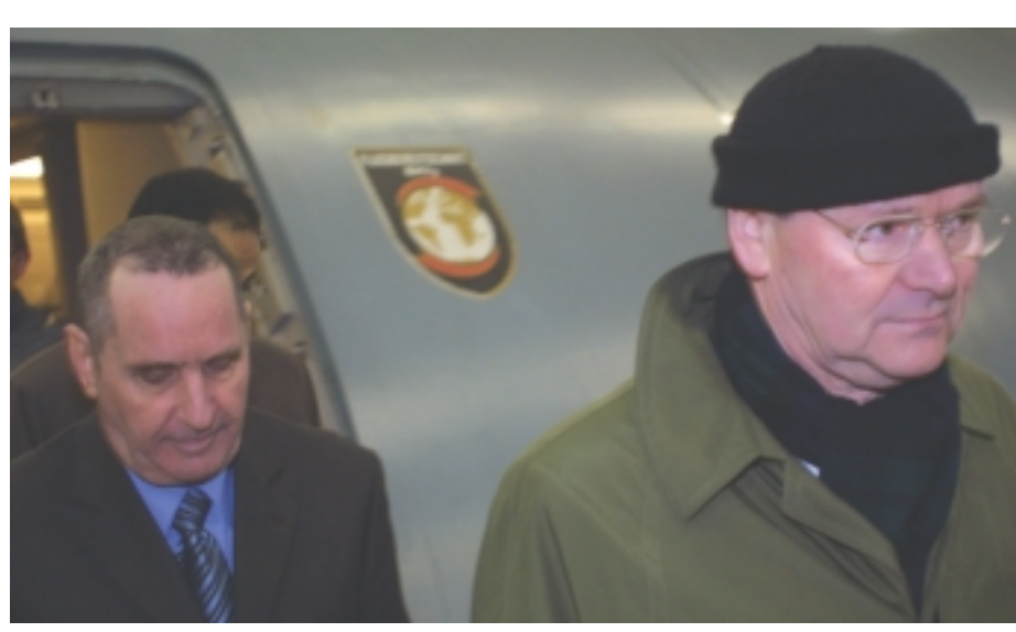
تننباوم في مطار المانيا