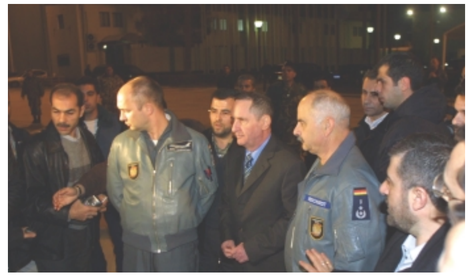
الأسير الصهيوني السابق تننباوم في مطار بيروت