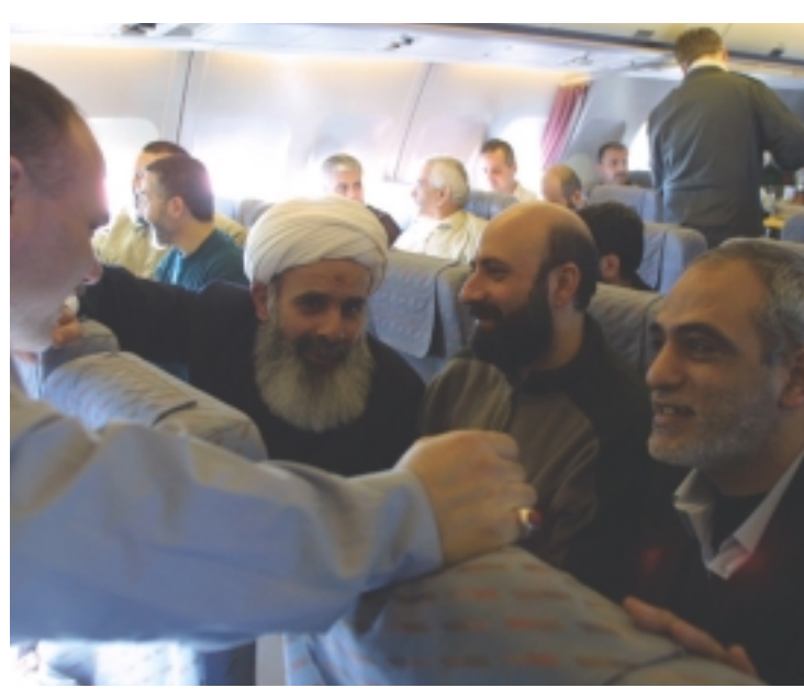
الاحرار في طريقهم الى الحرية في بيروت