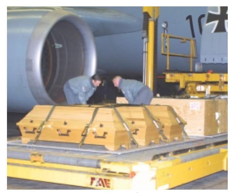
جث الجنود الصهيونية أثناء اعدادها لنقلها الى فلسطين المحتلة