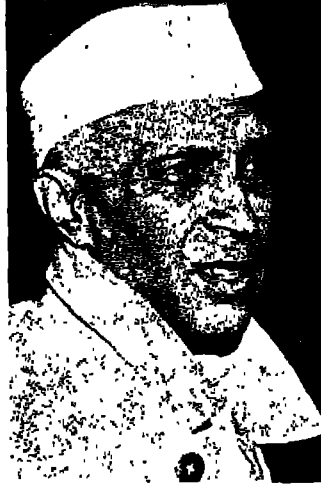
جواهر لال نهرو