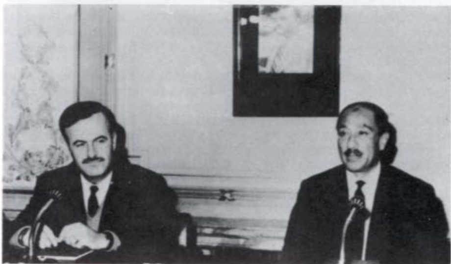
الرئيس الأسد مع الرئيس المصري السادات في القاهرة في تموز/ يوليو ١٩٧٢ .