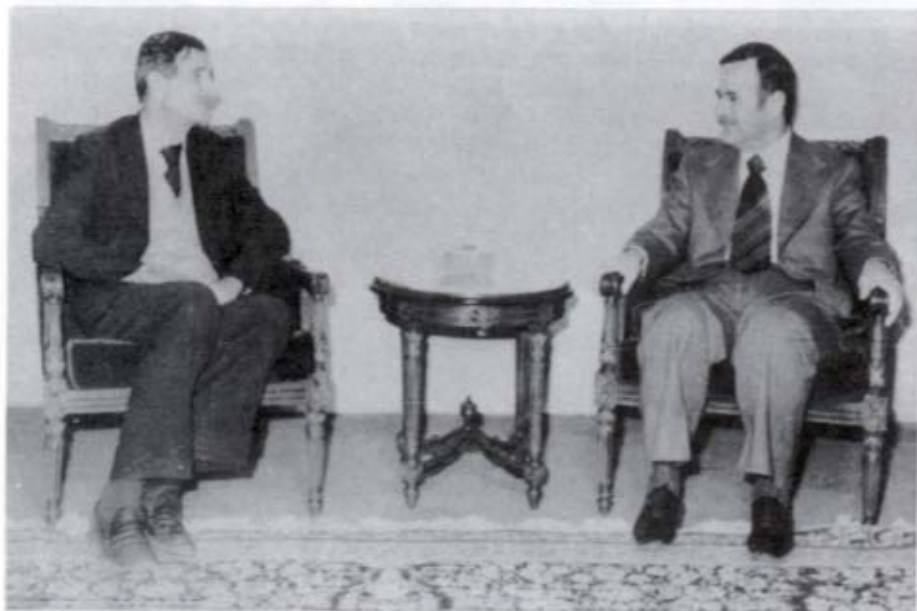
الرئيس الأسد وكمال جنبلاط في ٢٧ آذار/ مارس ١٩٧٥.