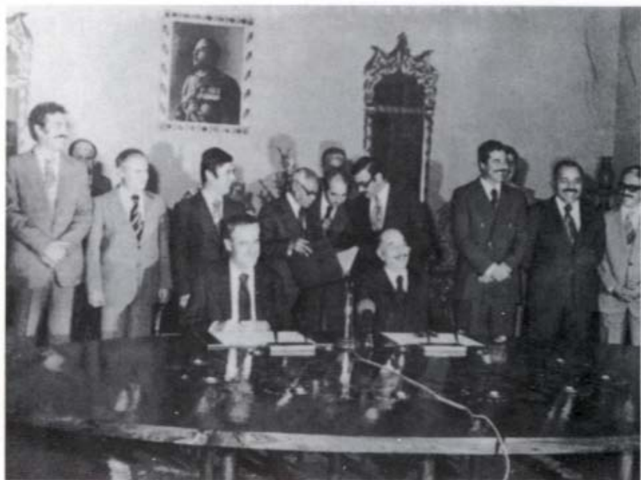
الرئيس الأسد وأحمد حسن البكر لدى توقيعهما المعاهدة السورية العراقية للعمل القومي في ٢٦ تشرين الأول/ أكتوبر ١٩٧٨ . وقد بدأ الرئيس الحالي صدام حسين واقفاً على اليمين .