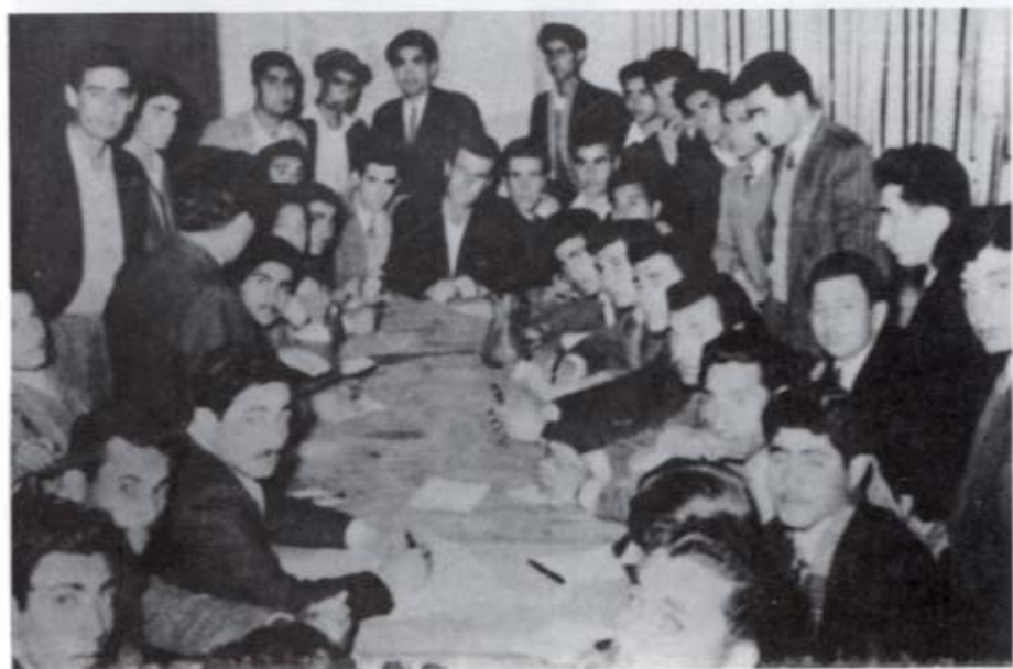
حافظ الأسد يرأس اجتماعاً لاتحاد الطلاب السوريين