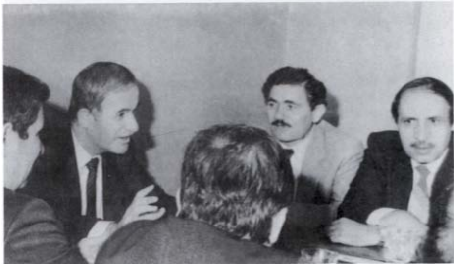
إحدى الاجتماعات الأولى للإدارة الجديدة لحزب البعث العربي الاشتراكي، عام ١٩٧١ . على يسار الرئيس حافظ الأسد، عبدالله الأحمر، الأمين العام المساعد ثم محمود الزعبي الذي أعيد انتخابه رئيساً لمجلس الشعب في ٢٧ شباط/ فبراير ١٩٨٦ .