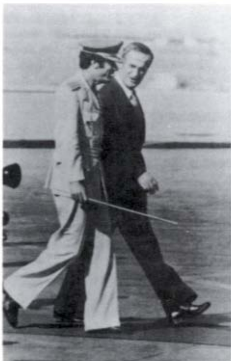
الرئيس الأسد مع العقيد معمر القذافي بعد تشكيل جبهة الصمود والتصدي.