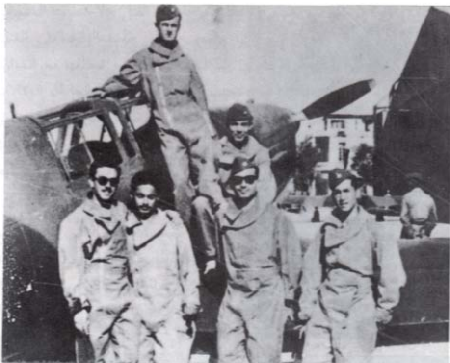
الأسد، ضابطاً في الكلية الجوية في حلب