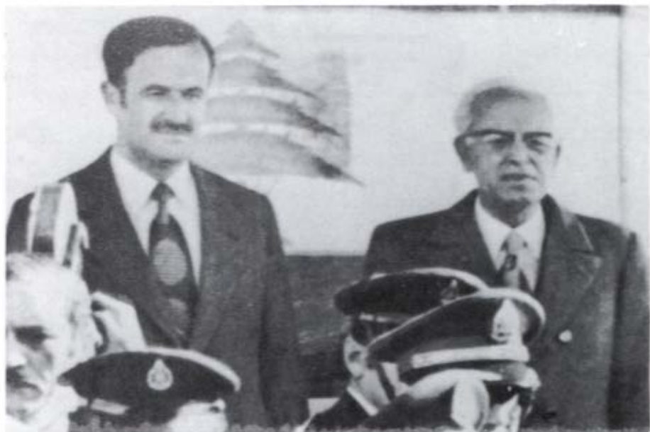
الرئيس الأسد مع الرئيس اللبناني سليمان فرنجية في شتورة في ٧ كانون الثاني / يناير ١٩٧٥