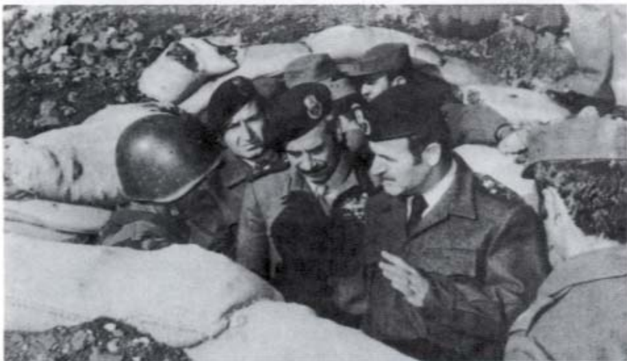
الرئيس الأسد ووزير الدفاع مصطفى طلاس، يراقبان المواقع الأمامية لخط المواجهة مع القوات العدوّة.