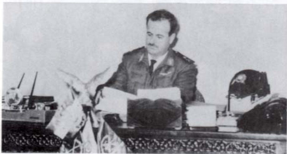
الأسد، وزيراً للدفاع وقائداً للقوات الجوية في مكتبه بعد ٢٣ شباط/ فبراير ١٩٦٦.