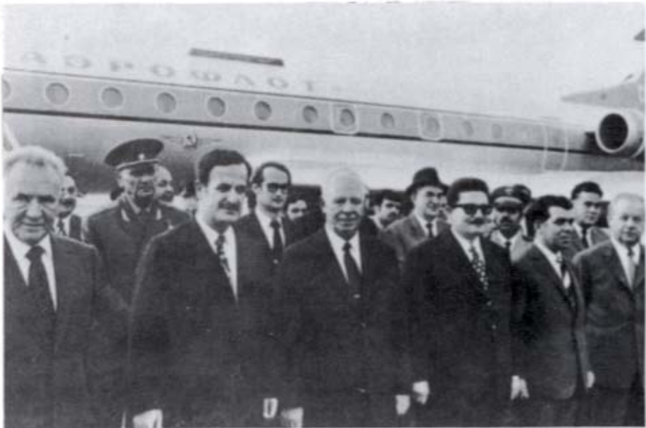
الرئيس الأسد في موسكو صيف عام ١٩٧٢ .