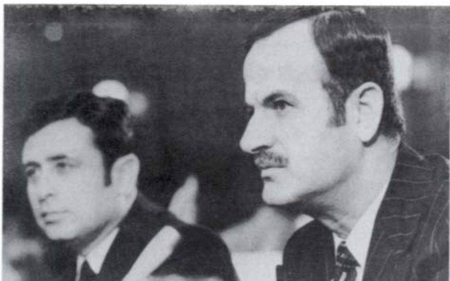
الجزائر، ٢٦ تشرين الثاني/ نوفمبر ١٩٧٣، يحضر الرئيس الأسد برفقة وزير الشؤون الخارجية عبد الحليم خدام، مؤتمر القمة السادسة للجامعة العربية