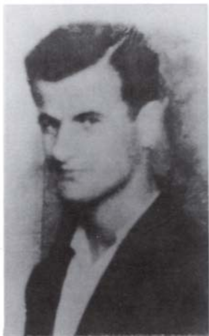
حافظ الأسد عام ١٩٤٧