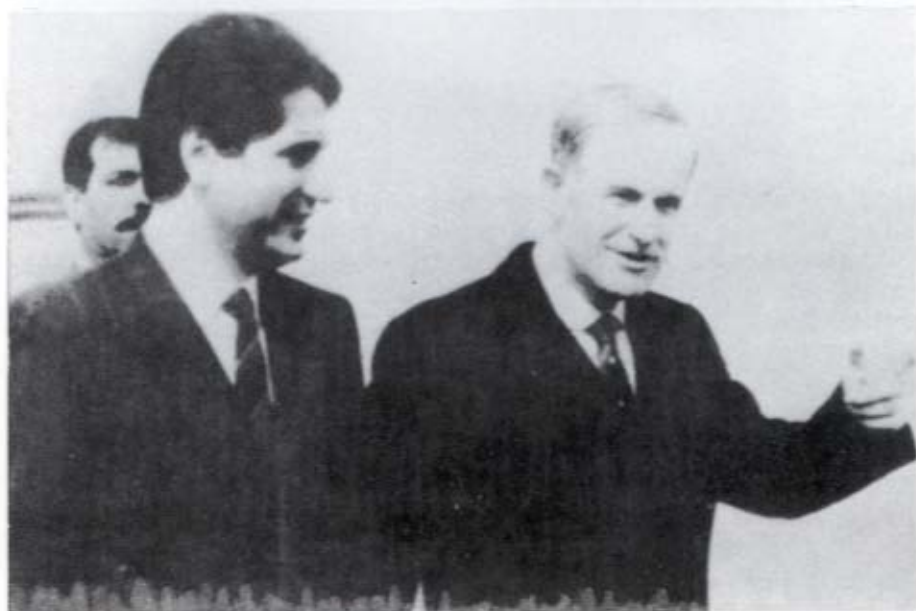
الرئيس الأسد مع الرئيس اللبناني أمين الجميل أثناء إحدى زيارته إلى دمشق في ١ آذار / مارس ١٩٨٤ .